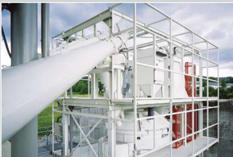
Модуль установки без обшивки металлом