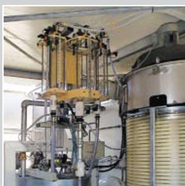
Весы для химдобавок / весы воды Фильтровальная установка с патронным фильтром