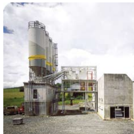
БСУ без обшивки металлом