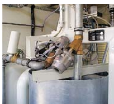
Весы воды в комплекте с вентильным узлом