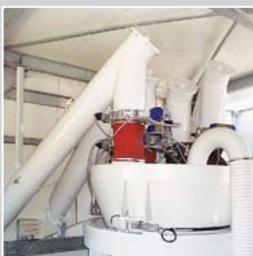
Шнеки для подачи материала на весы для цемента